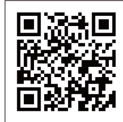
勤労者退職金共済機構 ウェブサイト