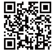
人材確保等支援助成金 ガイドブック