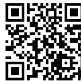
外国人労働者を雇用する 事業主様向けリーフレット